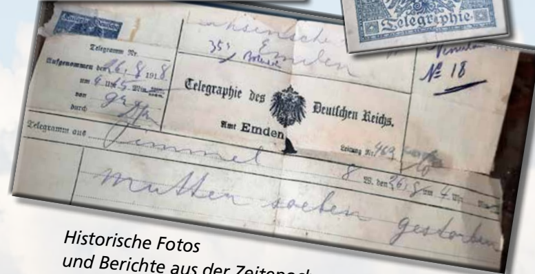
Historische Fotos und Berichte aus der Zeitepoche.

1 Benzolmotor 4 pferdig, wie neu 2 Glattstrohdrescher mit und ohne Breitschüttler 1 Stiftdrescher 2 Häckselmaschinen 1 Schrotmühle für Hand- und Göpelbetrieb hat preiswert zu verkaufen Joh. Brunken, Maschinenbauer Westrohefehn.